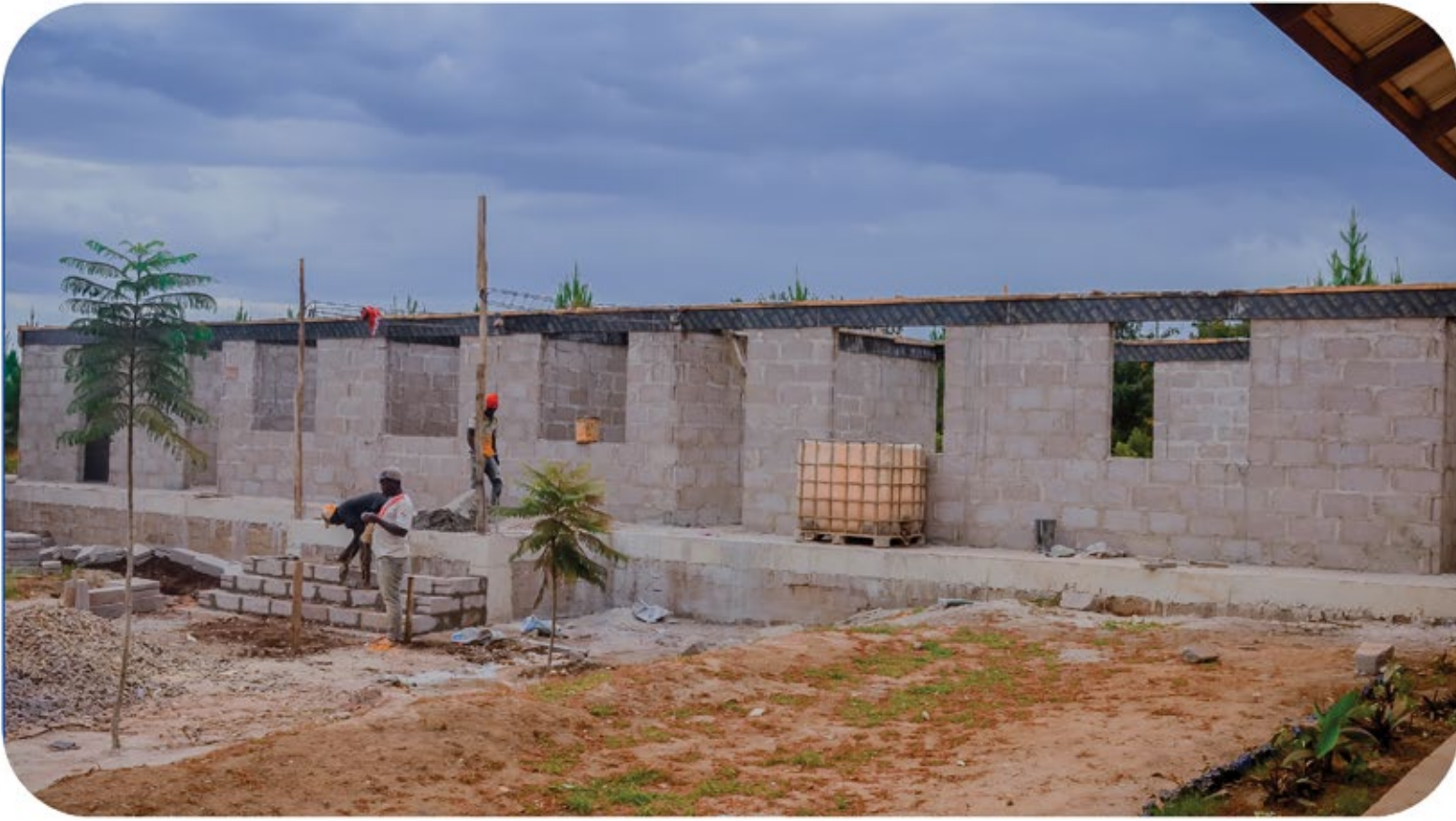
Shughuli za ujenzi wa jengo la Utawala katika shule ya Sekondari Nyanza kata ya Kalangalala ukiendelea. Mradi huu unatekelezwa kwa Tsh. 89,880,714.29 kutoka TASAF kupitia fedha za programu ya Kupunguza Umaskini - Ujenzi wa Miundombinu.