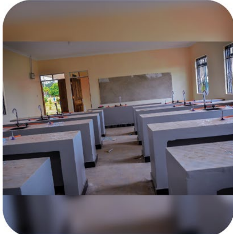
Muonekano wa nje na ndani wa Jengo la Maabara lenye vyumba viwili kwa ajili ya Masomo ya Sayansi kwa vitendo. ujenzi wa maabara hii unaendelea kutekelezwa kwa Tsh.120,000,000 kutoka Taasisi ya Elimu Tanzania (TEA).