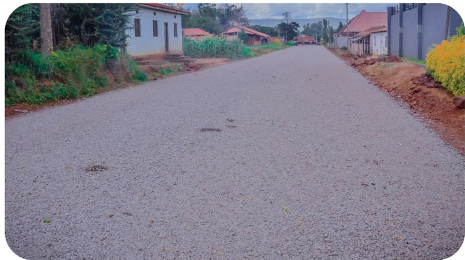
Barabara ya Polisi hadi Rugembe yenye urefu wa KM 1 ambayo imejengwa kwa kiwango cha lami nyepesi na mkandarasi Evax Construction Limited wa Muleba chini ya usimamizi wa Wakala wa Barabara za Vijijini na Mijini Tanzania ( TARURA ) Wilaya ya Geita