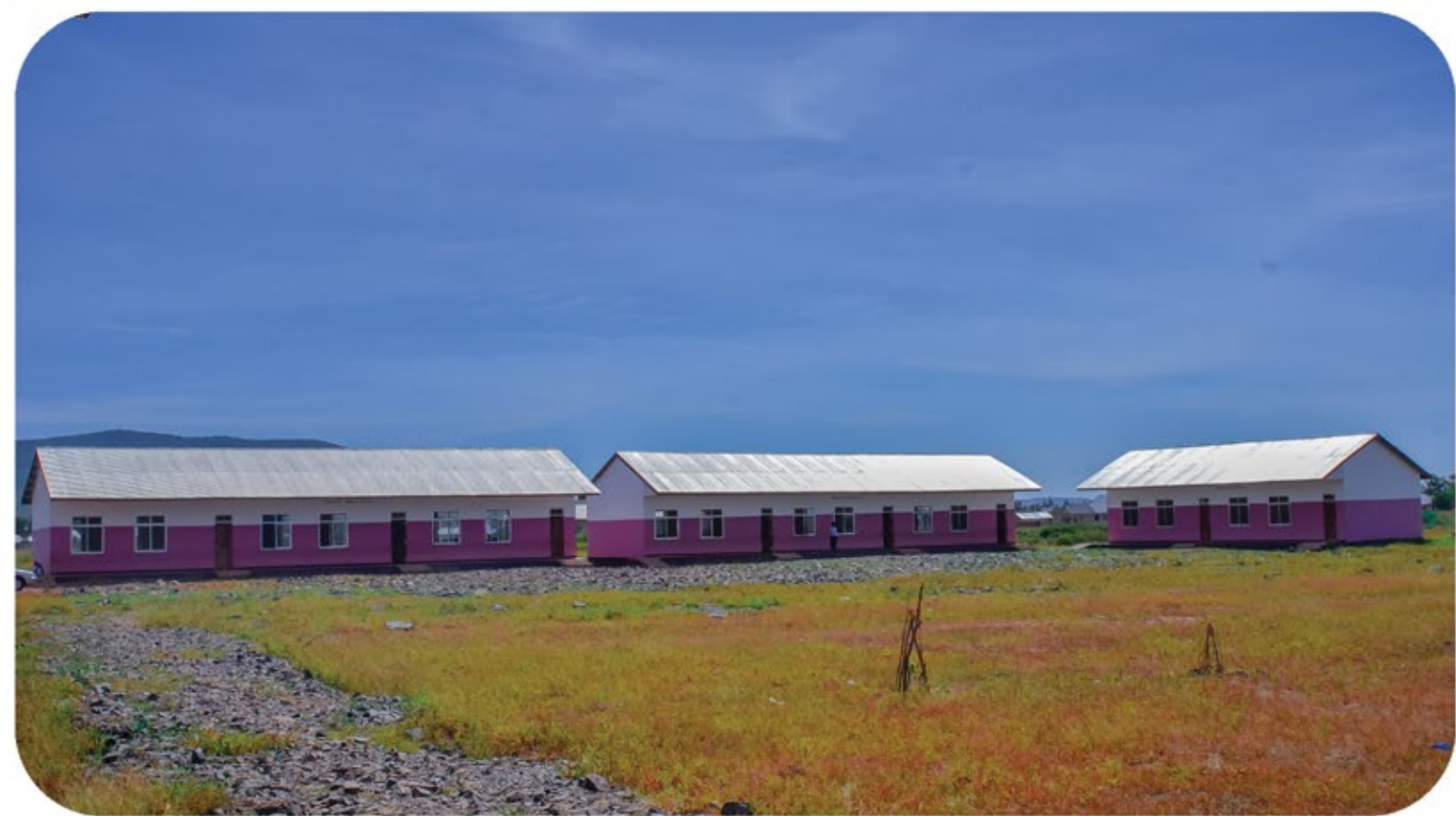
Muonekano wa shule mpya ya msingi Zanzui kata ya Buhalahala ambayo imejengwa kwa Tsh.250,000,000 kupitia fedha za huduma za kampuni kwa jamii ( CSR ) kutoka mgodi wa Dhahabu wa Geita katika eneo la ekari nane lililotolewa bure na Diwani wa kata ya Buhalahala Mhe.Dotto Zanzui Ludeha.