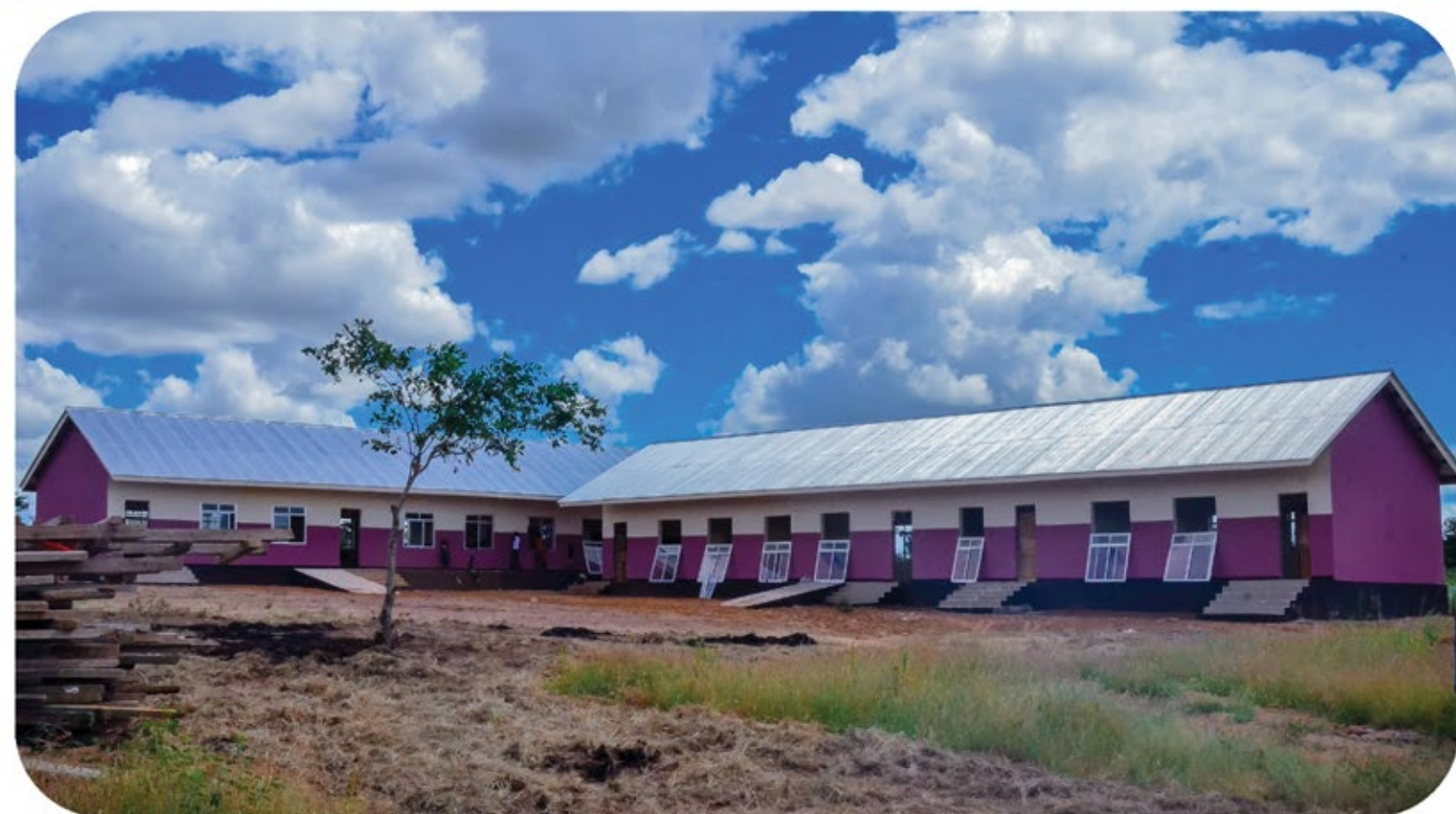
Ujenzi wa shule ya msingi Bungwe kata ya Bulela ukiwa kwenye hatua ya ukamilishwaji, Shule ya msingi Bungwe inajengwa kwa Tsh.160,000,000 kupitia mradi wa wajibu wa kampuni kwa jamii ( CSR ) kutoka mgodi wa Dhahabu Geita.