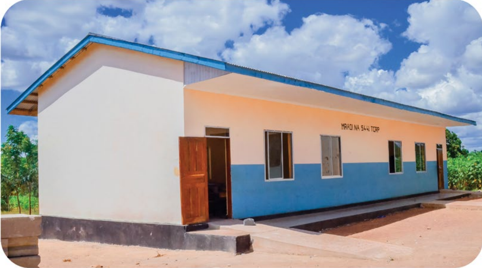
Muonekano wa Madarasa mawili katika Shule ya Sekondari Nyanguku yaliyojengwa kwa Tsh. 40,000,000 za Mpango wa Maendeleo na Ustawi wa Taifa na Mapambano dhidi ya UVIKO - 19.