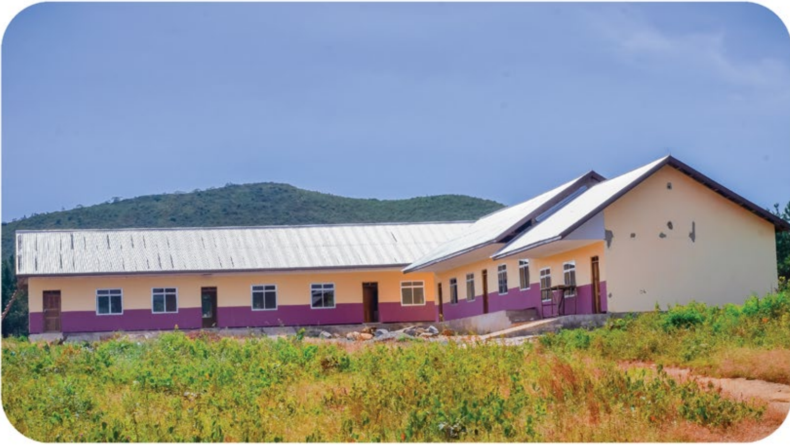
Ujenzi wa Shule mpya ya Sekondari Mtakuja ikiwa kwenye hatua ya ukamilishwaji. Shule hii mpaka kukamilika kwake itagharimu kiasi cha Tsh. 160,000,000 kupitia fedha za huduma za kampuni kwa jamii ( CSR ) Kutoka Mgodu wa Dhahabu wa Geita.