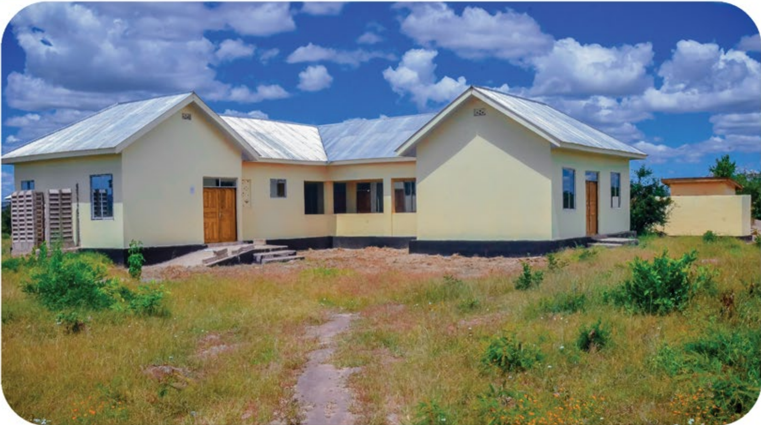
Ujenzi wa zahanati ya Mwamitilwa kata ya Kanyala ambao umetekelezwa kwa Tsh.50,000,000 za mapato ya ndani ya Halmashauri ya mji.