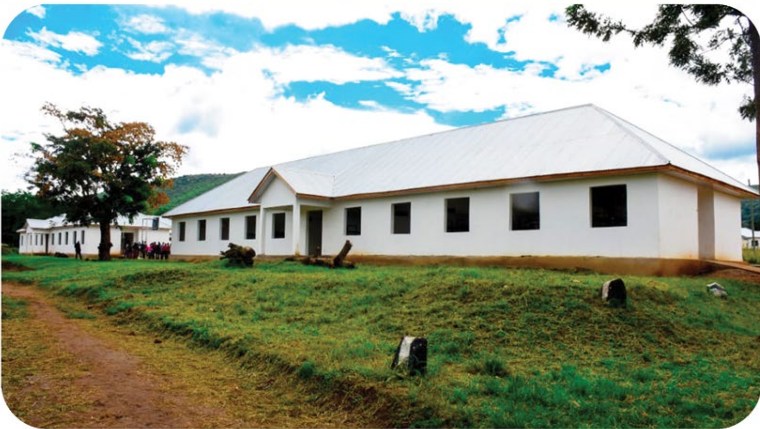
Ujenzi wa mabweni mawili ya wanafunzi katika Shule ya Sekondari Geita ukiwa kwenye hatua za ukamilishwaji, Mradi huu unatekelezwa kwa Tsh.160,000,000 kupitia Programu ya lipa kulingana na matokeo ( EP4R )