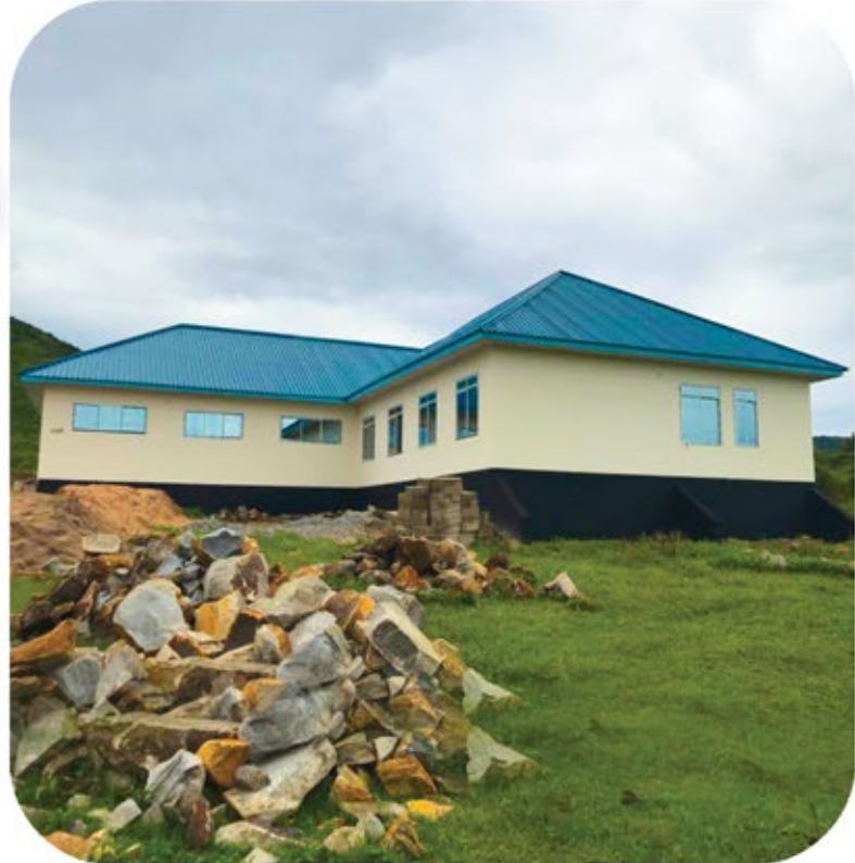
Upanuzi wa kituo cha Afya Mgusu ambapo jengo la Maabara na Wodi ya wazazi imekamilika pia jengo la upasuaji na nyumba ya watumishi ( three in one ) yanaendelea kujengwa. Mradi huu unatekelezwa kwa Tsh.500,000,000 kutoka Serikali kuu kupitia tozo za miamala ya simu.