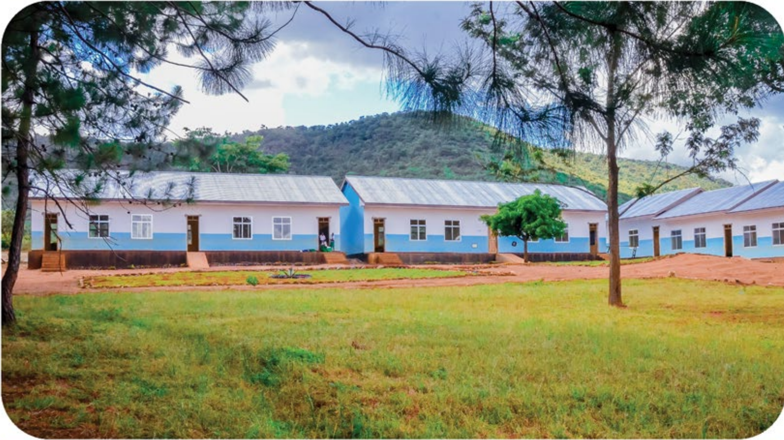
Muonekano wa kuvutia wa Shule mpya ya Msingi Samina kata ya Mtakuja ambayo imejengwa kwa nguvu za wananchi, mchango wa Mbunge wa Geita Mjini na Tsh. 100,000,000 kupitia fedha za huduma za kampuni kwa jamii kutoka Mgodu wa Dhahabu wa Geita (GGM).