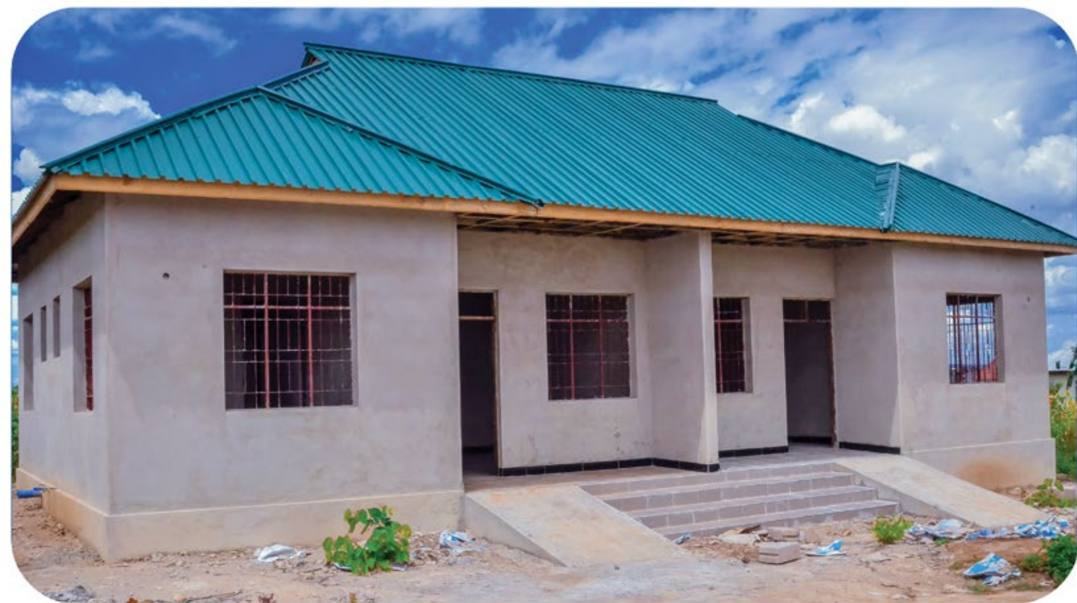
Ujenzi wa nyumba ya mtumishi katika zahanati ya Bombabili ambao umetekelezwa kwa Tsh. 50,000,000 kutoka Serikali kuu