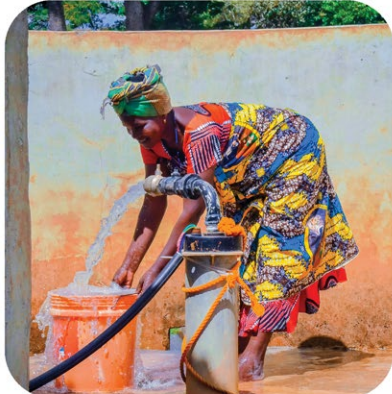
Mmoja wa wakazi wa mtaa wa Wigembya kata ya lhanamilo akichota maji safi na salama katika kisima kinachotumia umeme wa nguvu ya jua, Shughuli ya kutandaza mabomba itakapokamilika mradi huu utawanufaisha wakazi zaidi ya 2000 wa mtaa huo na maeneo ya jirani.