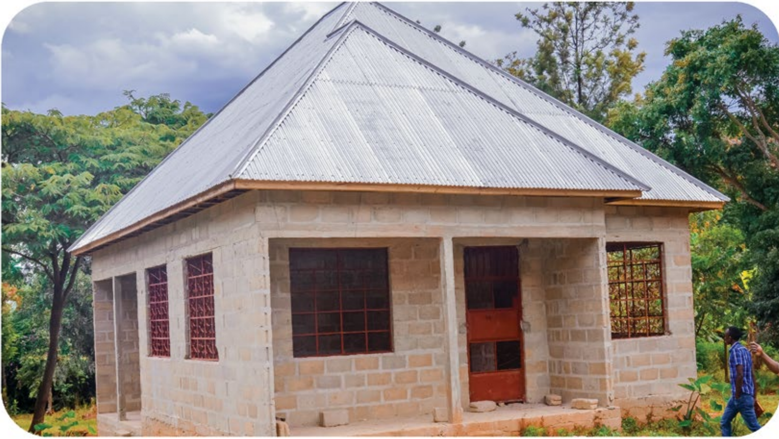
Ujenzi wa ofisi ya Mtaa wa Nyanza kata ya Kalangalala ambayo inajengwa kwa nguvu za wananchi pamoja na mapato ya mtaa, mpaka ukamilishaji wake itagharimu kiasi cha Tsh 50,000,000 .