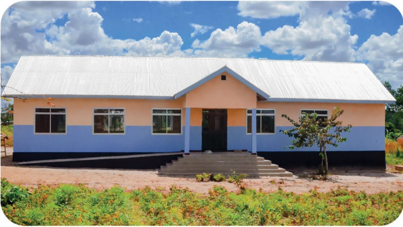
Jengo la utawala katika shule ya sekondari Nyanguku ambalo limejengwa kwa Tsh.60,000,000 kupitia fedha za huduma za kampuni kwa jamii ( CSR ) kutoka mgodi wa dhahabu wa Geita ( GGM)