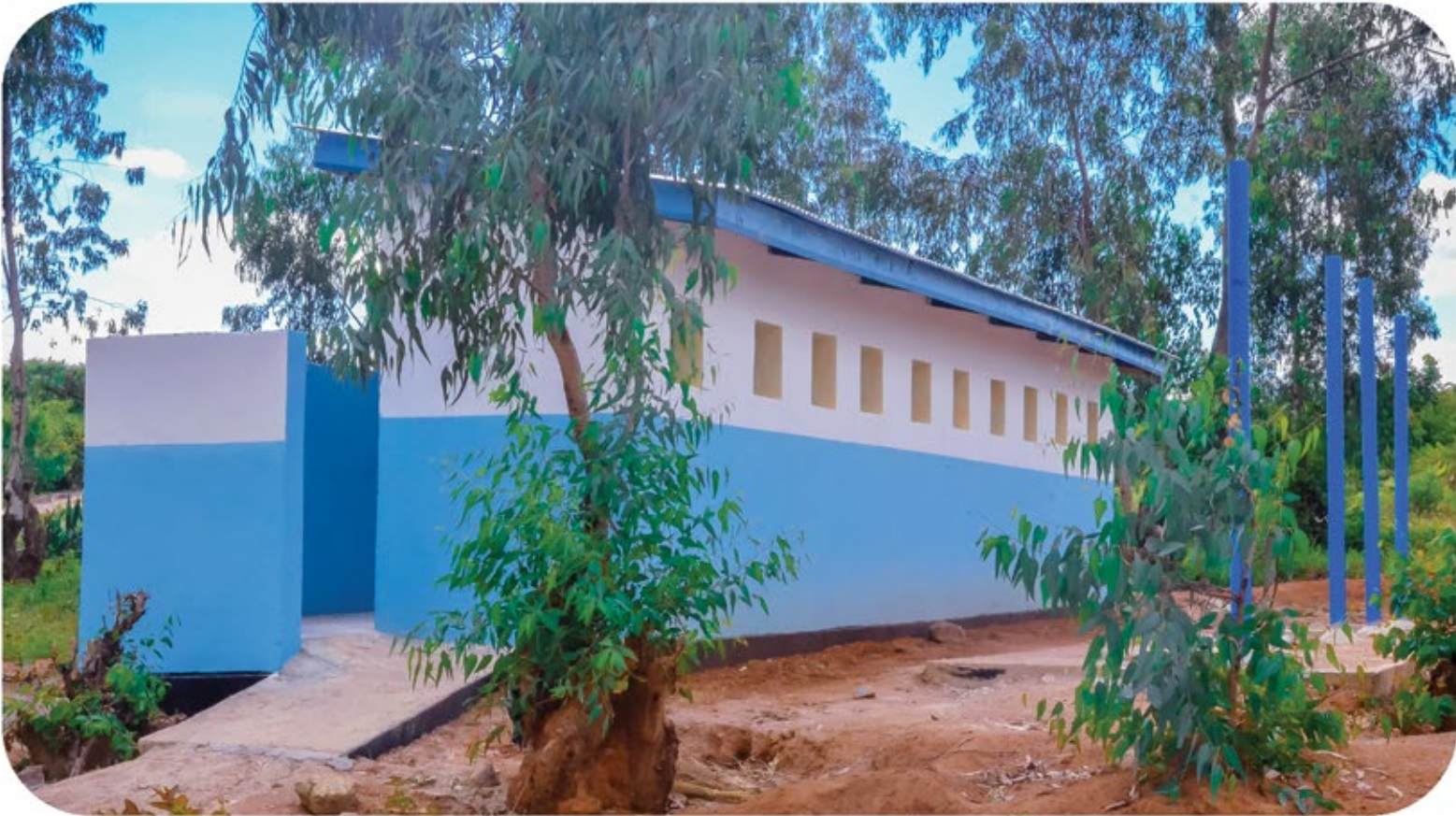
Choo bora na cha kisasa chenye matundu 10 kwa ajili ya wanafunzi katika Shule ya msingi Nyabubele kata ya Kasamwa ambacho kimejengwa kwa Tsh. 10,000,000 kupitia fedha za huduma za kampuni kwa jamii kutoka Mgodu wa GGM