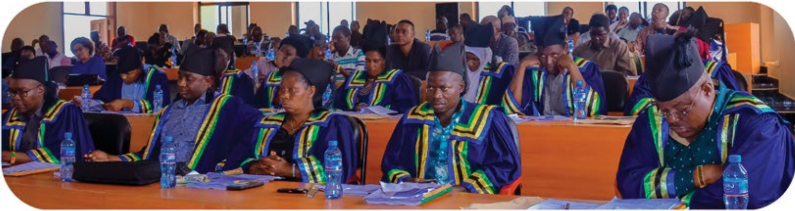
Wajumbe wa Mkutano wa Baraza la Madiwani la Halmashauri ya mji Geita wakiwa kwenye mkutano wa kujadili utekelezaji wa Miradi ya maendeleo.